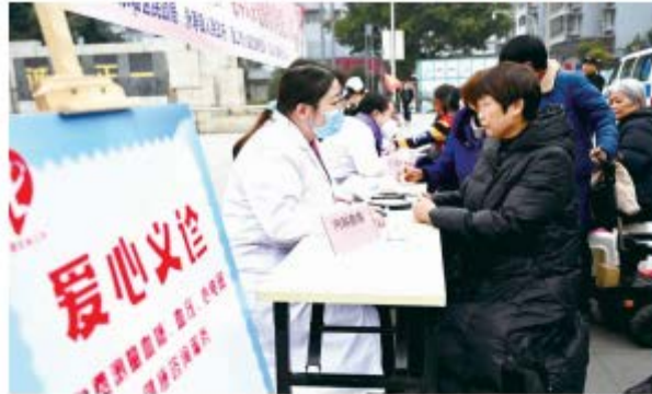
面对面进行健康咨询。

本报讯(眉山日报全媒体记者王允浩 文/图)2月21日,东坡区民政局、永寿镇、眉山心脑血管病医院、眉山市益家亲社工中心联合举办的“乐助银龄”老年人关爱服务项目爱心义诊义剪活动走进永寿社区,为辖区60岁及以上的居民提供免费体检、健康咨询等服务。