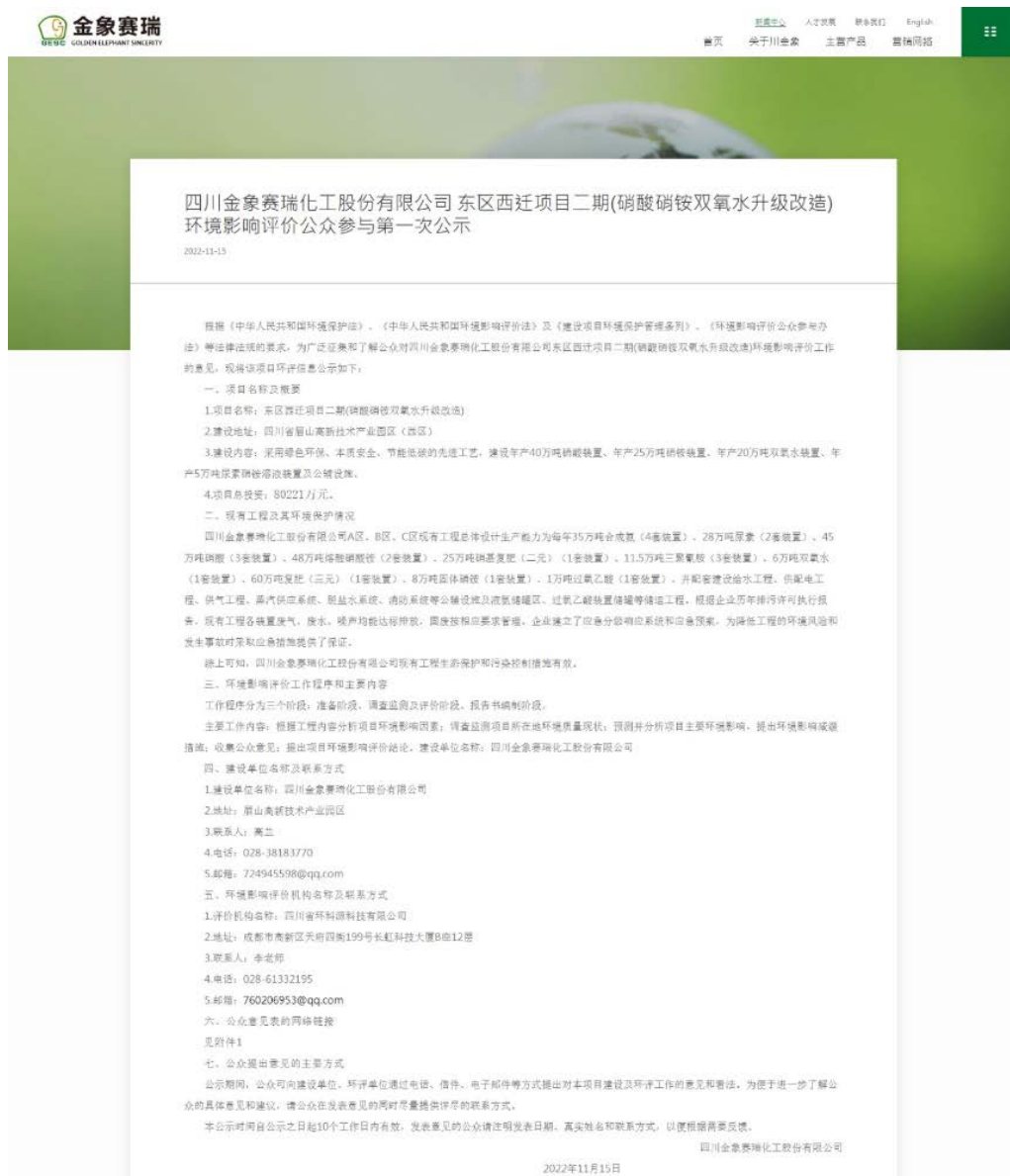
图 2-1 项目环境影响评价第一次公示截图